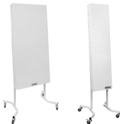
Подставка для рециркуляторов ОР-60,90,120УФ : 2 455 Р

ОР-УФ-120 / ОР-УФ-120СО - Подойдет для обеззараживания помещений до 200 м 2 (при высоте потолка до 3 м)