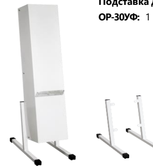
Подставка для рециркулятора ОР-30УФ: 1 370 Р