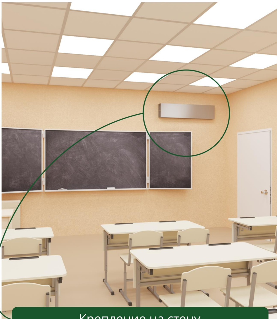
Крепление на стену